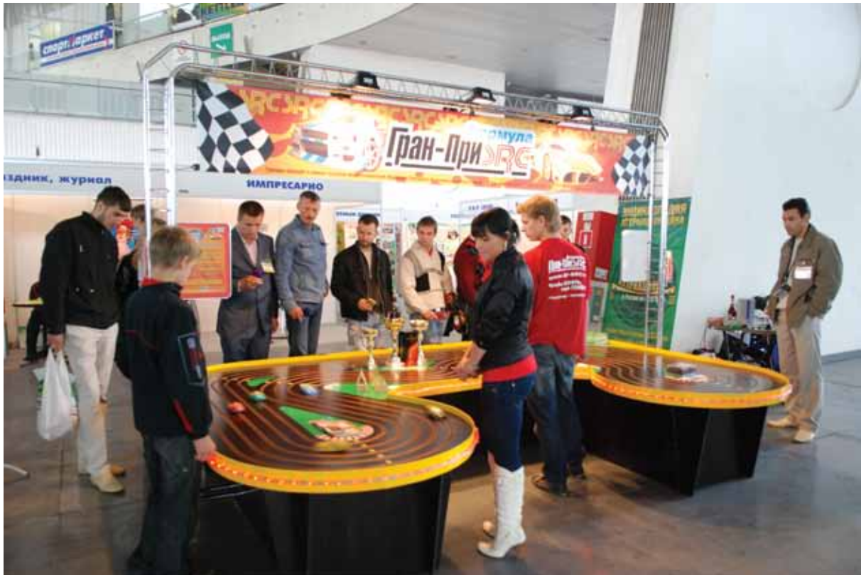
Презентация сети «Гран – При Формула SRC» на стенде компании «Болид»

большую территорию, и лично провел экскурсию по парку. В силу протяженности территории часть осмотра пришлось проделать на автобусе.