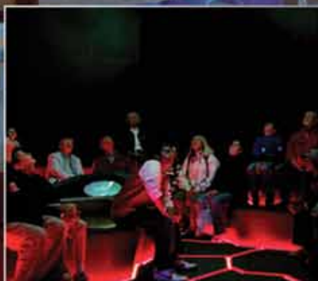
■ Данфосс Универс | Нордборг, Дания