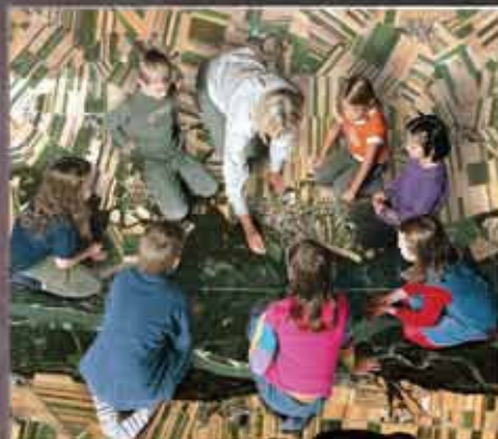
■ Национальный парк Донау-Ауэн | Австрия