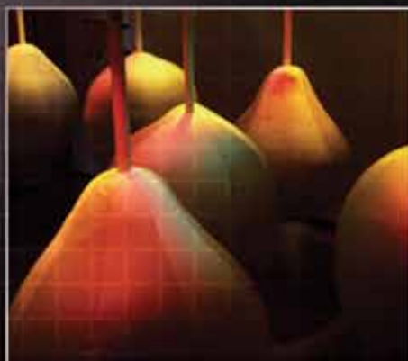
■ МИЦ | Ардаггер, Австрия