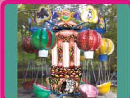
Аттракцион «ВОЗДУШНЫЕ ШАРЫ»

Посадочных мест – 12 Длина пути – 70 м Габариты пути – 25 x 10 м Потребляемая мощность – 6 кВт Пропускная способность – 120 чел/час