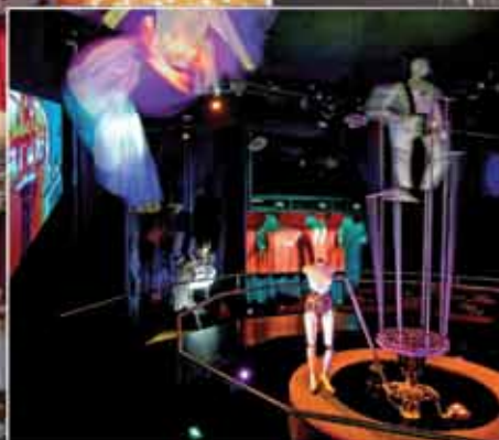
■ Хрустальные миры Сваровски | Ваттенс, Австрия