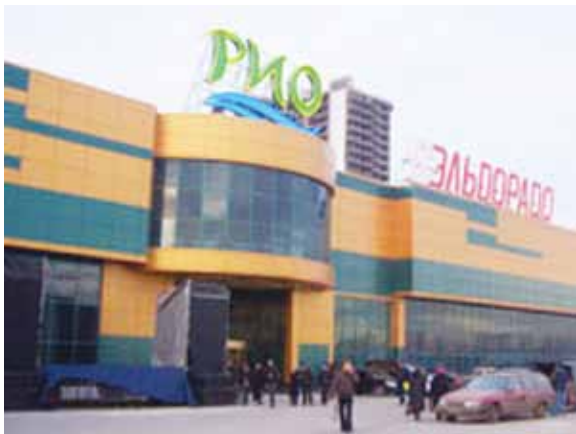
ТРЦ «Рио» (г. Москва)

Новый боулинг-центр отличает стильный итальянский дизайн и уютная зона отдыха для игроков.