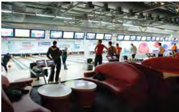
Боулинг-зал в РЦ «Космик. Белая Дача» (г. Москва)

Раньше зорб был доступен только при корпоративных заказах. Теперь опробовать этот необычный аттракцион может каждый воронежец.