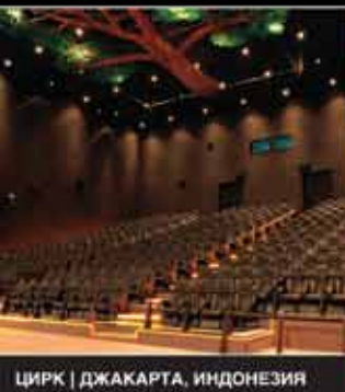
ЦИРК | ДЖАКАРТА, ИНДОНЕЗИЯ