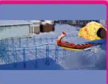
Аттракцион «ЛЕДЯНАЯ ГОРКА»

Габариты пути – 18 x 6 м Длина – 50 м Количество кабин – 3 Количество посадочных мест – 10 Пропускная способность – 300 чел/час