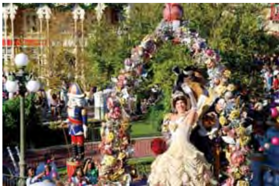
Парад сказочных героев в парке Disney's Magic Kingdom

Оплата здесь на уровне средней оплаты аналогичных категорий работников г. Орlando.