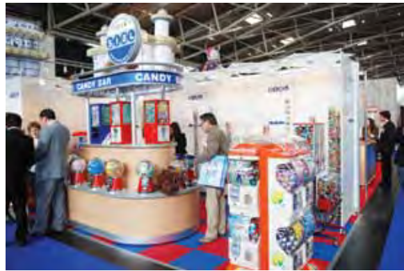
Компания SIAL (Германия) представила на выставке аппараты по продаже жвачки и конфет «CANDY BAR»

Так, например, компания «PIE INFLATABLES» (Турция) предложила очень оригинальный вариант соединения игровой комнаты и батута.