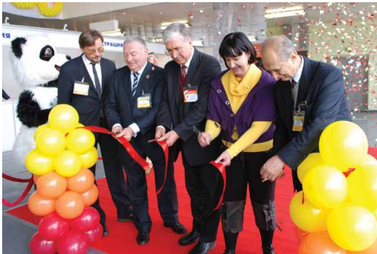
Торжественная церемония открытия выставки «РАППА Осень 2008»

Стало уже хорошей традицией проводить в рамках осенней выставки двухдневный тур