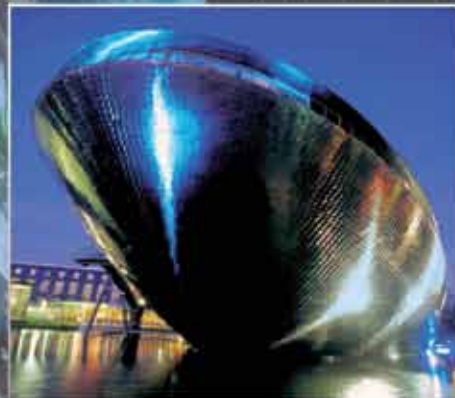
■ Научный центр Универсум | Бремен, ФРГ