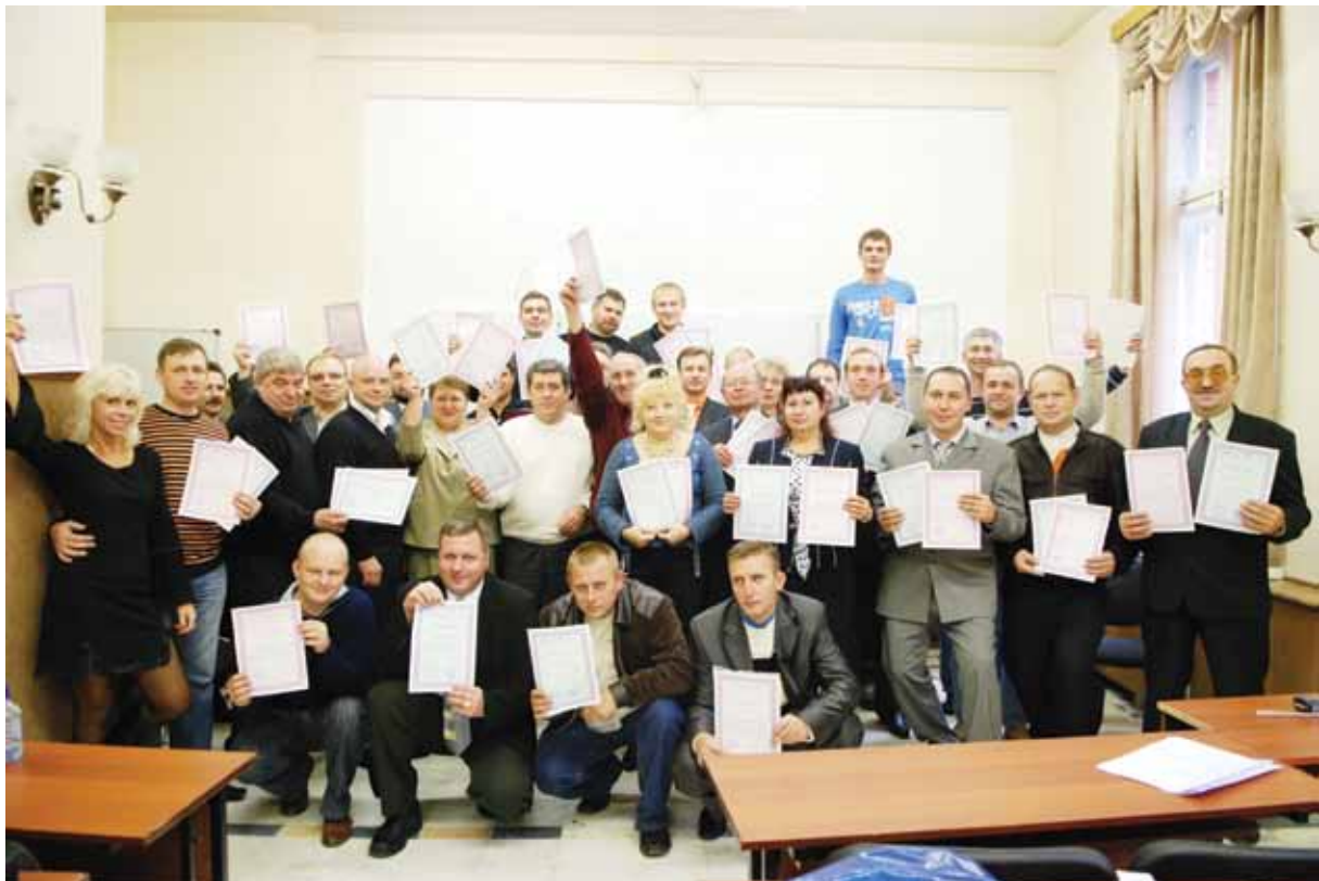
Выпускники Учебного Центра РАППА. Учебная сессия 13-18 октября 2008 г.

В число сертифицированных специалистов, обучившихся в Центре, входят руководители предприятий, заместители директоров, старшие администраторы, главные инженеры, технические руководители. Также обучение и сертификацию в Центре прошли более 30 инженеров-инспекторов государственных инспекций по надзору за техни-