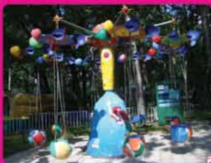
Цепочная карусель «Космос»

Диаметр – 6 м Кол-во посадочных мест – 12 Пропускная способность – 350 чел/час