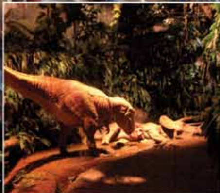
■ Гондвана | Шиффвайлер, ФРГ