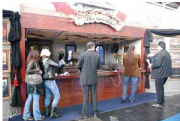
Электронный тир «THE EYECATCHER» выполненный в стиле «ужасов» на стенде компании «SHOOTING GALLERIES»

горе. У меня в руках был фотоаппарат, и я на самом деле боялся уронить его, настолько были реалистичны ощущения. Конечно, такой кинотеатр будет пользоваться спросом в любом парке.