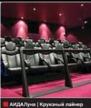
АИДАЛуна | Круизный лайнер