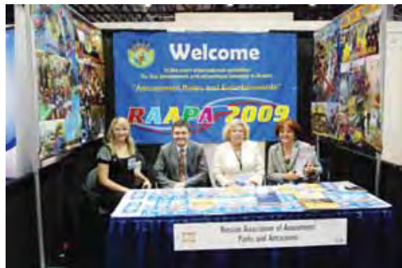
Выставка IAAPA 2008. Стенд РАППА.

Первое, что нужно отметить – это доброжелательное отношение персонала не только к посе-