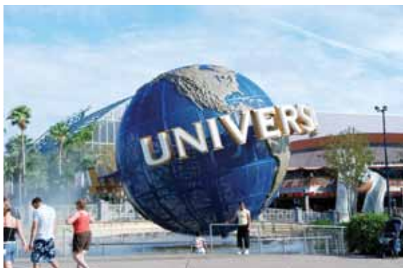
Парк Universal Studios

нереальны, но применив фантазию и подручные материалы (такие как камень, баннеры и т.д.) вполне возможно придать индивидуальные характеристики аттракционам, выдержав их в общем стиле с темой парка. Причем тематизировать надо не только аттракционы, но и точки питания, места отдыха и др. В Орландо, во всех парках без исключения встречались две классические темы - пираты и динозавры, популярные у всех возрастов.