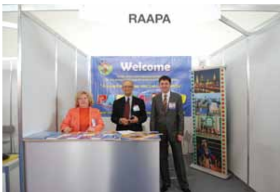
Выставка EAS 2008. Стенд РАППА.

влекла фигуристка, танцующая на льду. Это был стенд компании «XTRAICE» (Испания), производящей искусственный пластиковый лёд. Подобные предложения сегодня интересны сами по себе – в силу популярности многочисленных ледовых шоу, но «XTRAICE» ещё и грамотно прокларировала свою продукцию на выставке: на протяжении всех дней по этому льду катались красивые девушки. Выглядело всё это более чем привлекательно, и, думаю, что такая организация стенда привела к положительным результатам от участия в выставке.