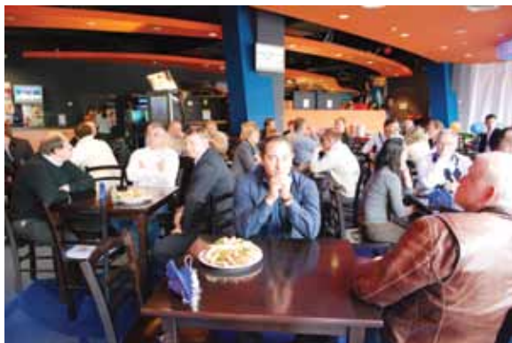
Заключительный этап тура - развлекательный центр «Игромакс» - ТРЦ «Европейский»

Не важно, какому типу развлечений Вы посвятили профессию – парку аттракционов, семейному развлекательному центру, аквапарку или зоопарку – Вы найдете то, что Вам нужно на нашей выставке в апреле 2009г.!