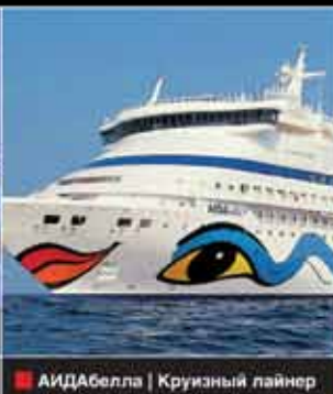
АИДАБелла | Круизный лайнер