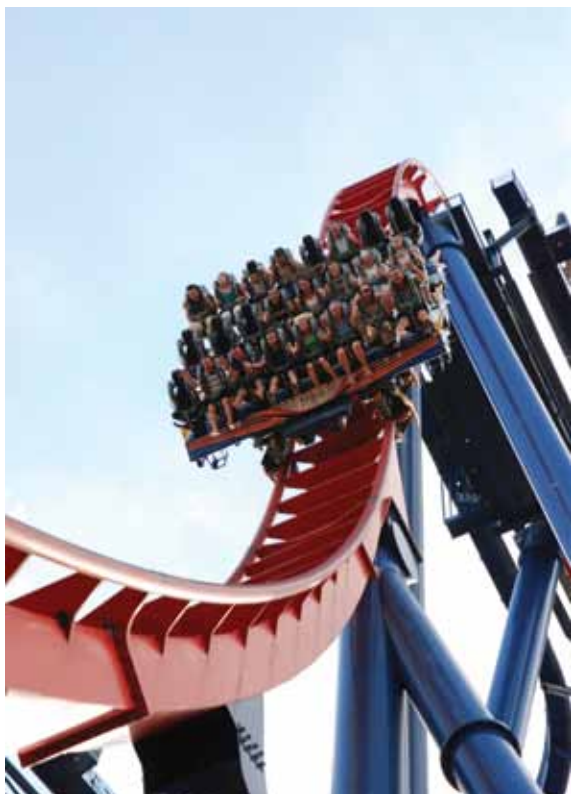
Одна из крупнейших катальных гор находится в парке Universal Islands of Adventure

болки и еще тысячи наименований) приносит доход, по моему мнению, сопоставимый с доходом от посещения самих аттракционов. В наших парках эта практика часто отсутствует.