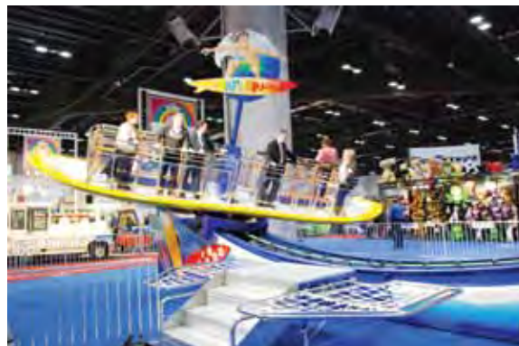
Выставка IAAPA 2008. Стенд компании Zamperla (Италия)

С 9 по 24 ноября 2008 г. мне представилась возможность в составе группы руководителей российских парков атракционов и развлекатель-