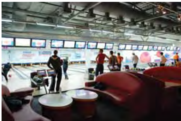
Боулинг – самое популярное развлечение у посетителей развлекательного центра «Космик. Белая Дача»