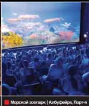
Морской зоопарк | Албуфейра, Португалия