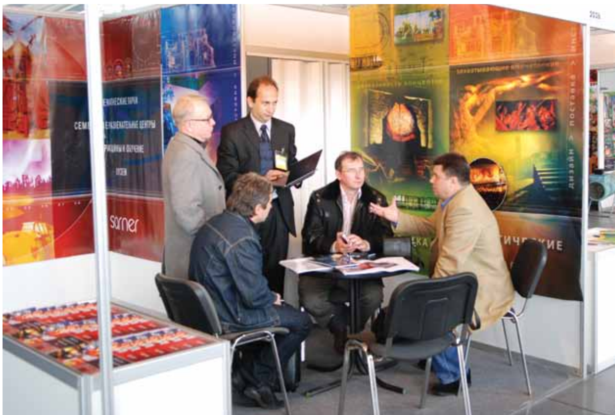
Переговоры на стенде компании «Sarnet» (Великобритания)

(15 – 16.09.08) по паркам и развлекательным центрам Москвы для специалистов индустрии развлечений. 60 руководителей развлекательных учреждений из 35 городов России и Украины приняли участие в этом мероприятии.