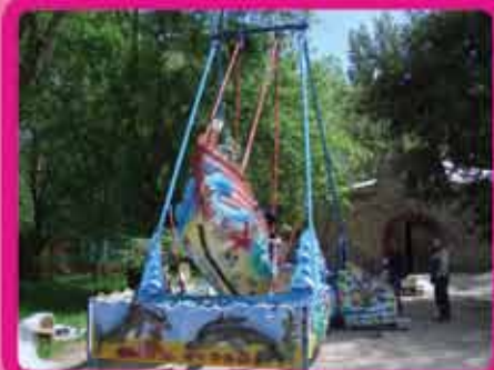
Аттракцион «Корабль на волнах»

Для детей до 15 лет и весом не более 50кг Кол-во посадочных мест – 8 Размах во время движения – 9 м Высота – 4,5 м Потребляемая мощность – 1,5 кВт