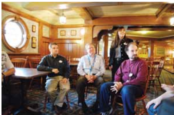
Участники тура встретились с менеджерами парка Disney's Magic Kingdom

го общепита. В ряде парков были организованы встречи с их руководством, ведущими техническими специалистами и менеджерами по управлению персоналом и организации праздничных мероприятий. Также была предоставлена возможность более подробно ознакомиться с принципами устройства, управления и контроля за работой эксклюзивных масштабных аттракционов, являющихся в своем роде единственными в мире (например, катальная гора «Эверест» и др.).