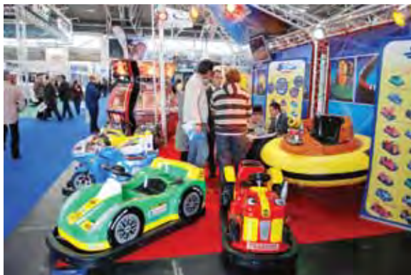
Компания SELA Cars (Италия) представила на выставке картинги, бамперкары, детские мотоциклы и другое оборудование.

Также на выставке были представлены традиционные сетчатые батуты итальянского производства, которые отличаются высоким качеством сетки и металла.