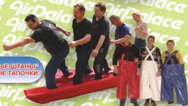
"КОМАНДНЫЕ ШТАНЫ!" "КОМАНДНЫЕ ТАПОЧКИ!"

193079, Россия, г. Санкт-Петербург, Октябрьская наб., 80, корп. 1. Тел./факс (812) 44-77-949 e-mail: market@airpalace.spb.ru www.airpalace.ru