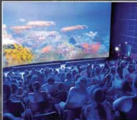
■ Морской зоопарк | Албуфейра, Порт-я