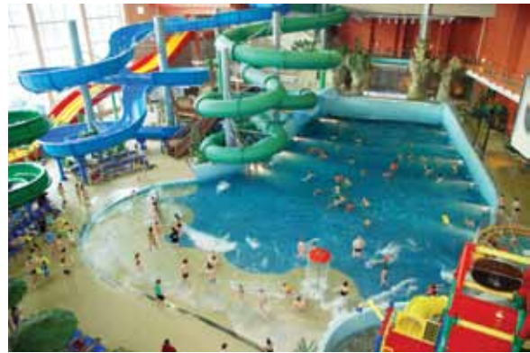
Практические занятия Учебного Центра РАППА часто проходят в аквапарке «Ква-Ква Парк» (Московская область)

Своих сотрудников в «Учебный Центр РАППА» направляют предприятия из всех сфер индустрии развлечений: производители аттрак-