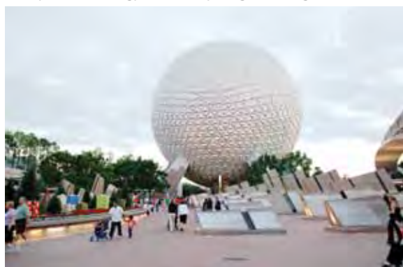
Выставка IAAPA 2008. Карусель на стенде компании FELIMANA LUNA PARK (Аргентина)

С помощью аттракциона «Space ship Earth» (Космический корабль Земля) в парке Disney's Epcot можно познакомиться с историей Земли с древнего мира и до наших дней