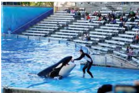
Шоу касаток в парке Sea World Orlando

Вывод второй. Создавать условия, при ко-