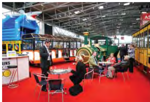
Компания TSCHU-TSCHU TRAINS (Германия) представила на выставке широкий ассортимент паровозов

Активно на своём стенде работала сертификационная компания «TÜV» (Германия). Она всегда достойна упоминания, так как сертификация «TÜV» – это знак качества для любого производителя. Если, например, российская компания хочет выйти на мировой уровень, то сертификация «TÜV» ей просто необходима, поскольку это признанная гарантия качества. В Мюнхене «TÜV» была представлена достаточно широко, и поток, интересующихся предложениями этой компании, не уменьшался в течение всех дней работы выставки.