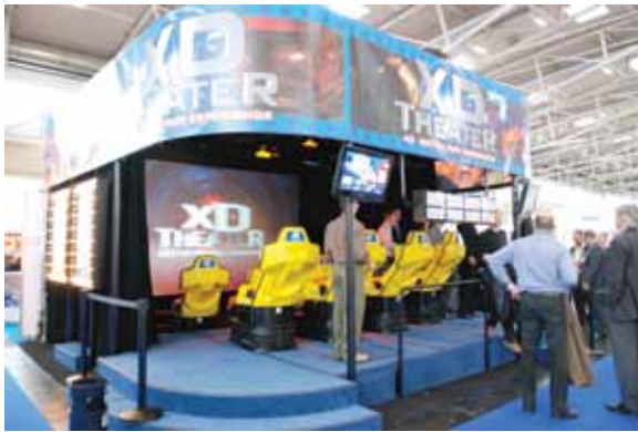
Выставка EAS 2008. «XD THEATER» – 4D кинотеатр американского производства.

все дни на стенде «Мира» оживленно толпились посетители. А посидеть в кабинке колеса обозрения, которая выставилась на стенде, мог каждый желающий.