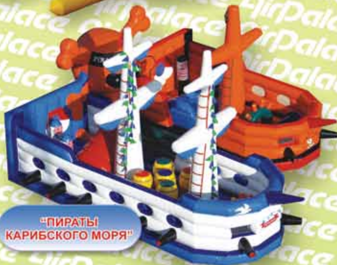
"ПИРАТЫ КАРИБСКОГО МОРЯ"