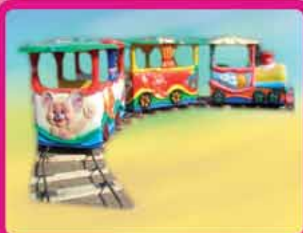
Паровоз «ВЕСЕЛЫЙ ПОЕЗД»

Высота – 3 м Диаметр – 9 м Количество образов – 8 Кол-во посадочных мест – 12 Потребляемая мощность – 3 кВт