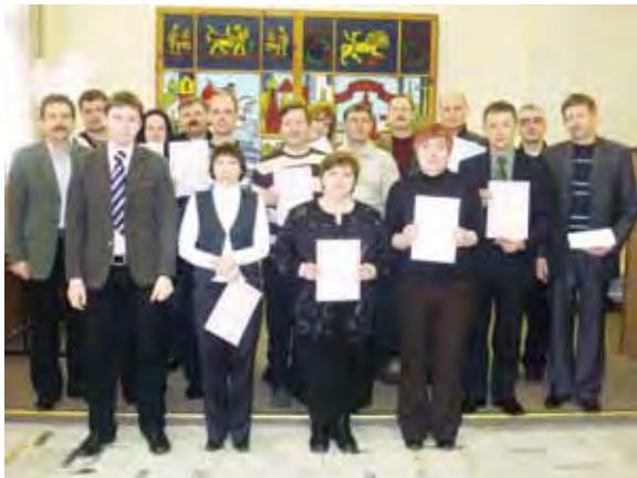
Выпускники Учебного Центра РАППА. Учебная сессия 16-21 февраля 2009 г.

ческим состоянием самоходных машин и других видов техники, на которые в ряде субъектов РФ возложены функции по надзору за безопасной эксплуатацией аттракционов.