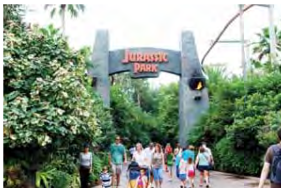
Тематическая зона « Jurassic Park » в парке Universal Islands of Adventure

Участники тура смогли познакомиться с работой практически всех знаковых атракционов, с разнообразными формами архитектурного и дизайнерского оформления различных игровых и ландшафтных зон, территорий, атракционов, мест отдыха, а также организацией парково-