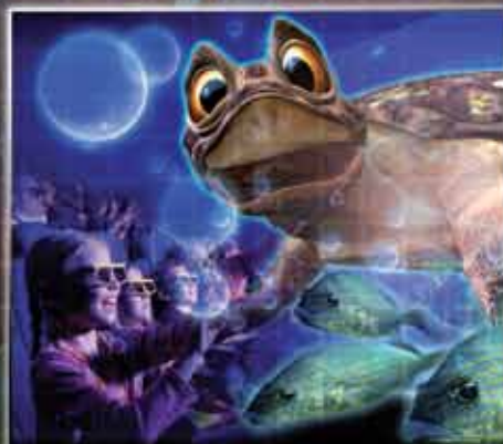
40x 4D КИНОТЕАТРОВ ПО ВСЕМУ МИРУ