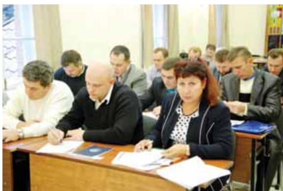
Слушатели готовятся к защите практического задания