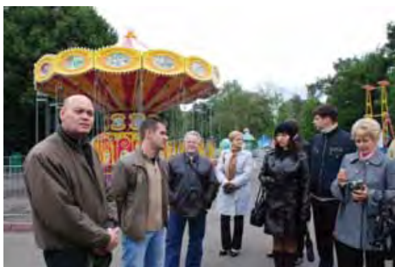
Посещение Московского Зоопарка вызвало у участников тура бурю эмоций