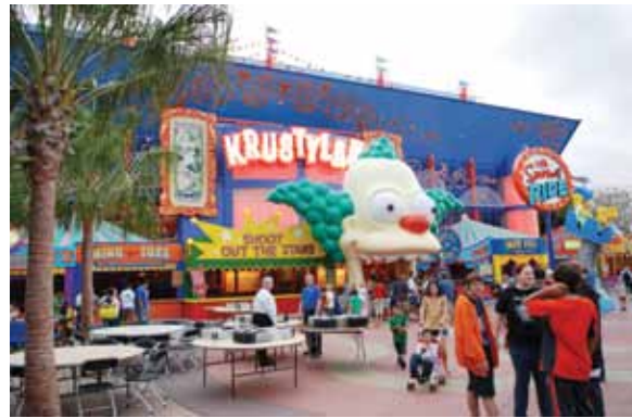
Аттракцион «The Simpson Ride» - катальная гора с 3D эффектами

Во-вторых, поездка позволила мне переоценить свои возможности развития материально – технической базы с учетом увиденного. Это и новые аттракционы, и их сопровождение, и новые технологии, и отношение технического персонала к своим обязанностям.