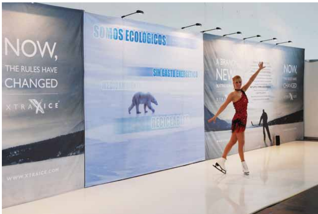
Оригинальная презентация искусственного льда на стенде компании «XTRAIICE» (Испания)

На следующий день, сразу после открытия, я начал осмотр уже работающей экспозиции, и прямо у входа на выставку мое внимание при-