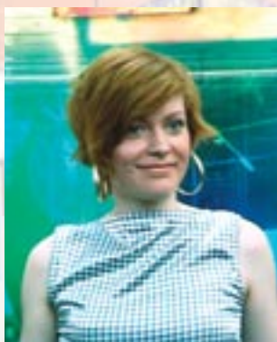
ЗАО УК «Планета Развлечений», г. Москва