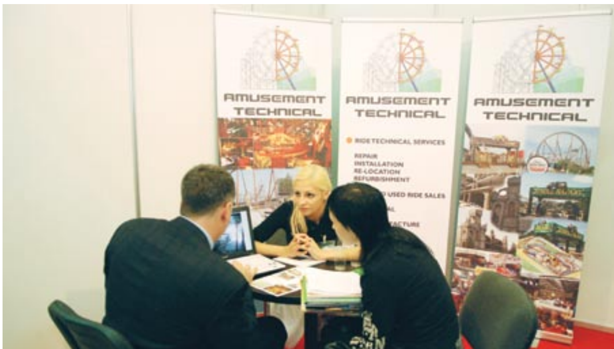
РАППА 2008. Переговоры на стенде компании «Amusement technical» дали положительный результат

подчеркнул важность и необходимость привлечения в аквапарки посетителей до 7 лет, после чего подробно объяснил все плюсы своей позиции. Полный текст доклада приведён на странице 40.