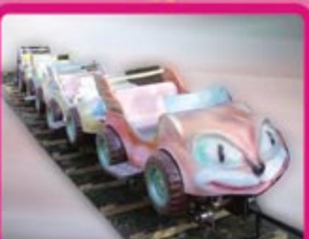
Аттракцион «Джипы» Длина рельсового пути – 50 м Кол-во посадочных мест – 8 Кол-во кабин – 4 Пропускная способность – 240 чел/час