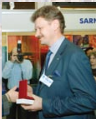
ООО «Оптосиб», г. Новосибирск