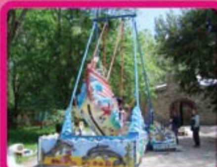
Аттракцион «Корабль на волнах» Размер платформы – 4 x 5 м Высота – 7 м Кол-во посадочных мест – 10 Потребляемая мощность – 2,2 кВт