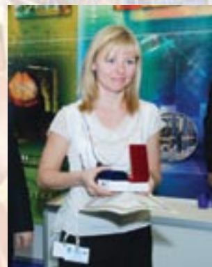
Компания «МИР», г. Москва