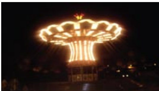
Аттракцион «Цепочная карусель»