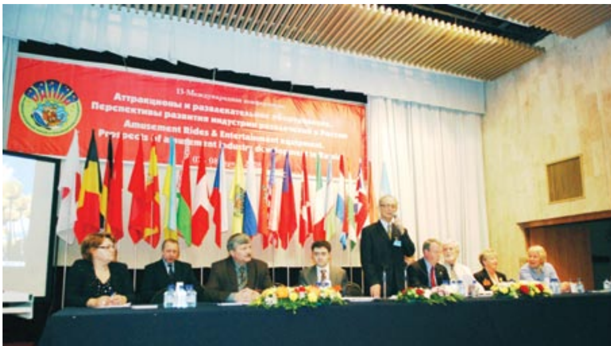
РАППА-2008. Открытие 13-й Международной конференции «Перспективы развития индустрии развлечений в России»

для обсуждения самых сложных и серьезных проблем и вопросов, волнующих участников рынка развлечений.