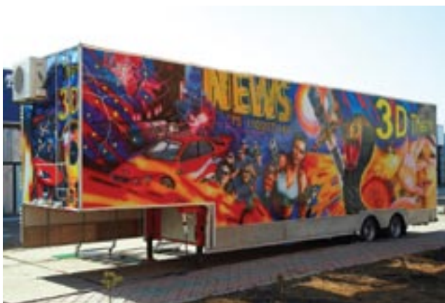
Аттракцион «3D Кинотеатр»