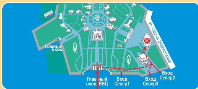
Схема для прохода на выставку

РАППА 2009 – это специализированная деловая программа с участием ведущих мировых экспертов и обсуждением современных технологий развития развлекательного бизнеса, его возможностей и перспектив в России.