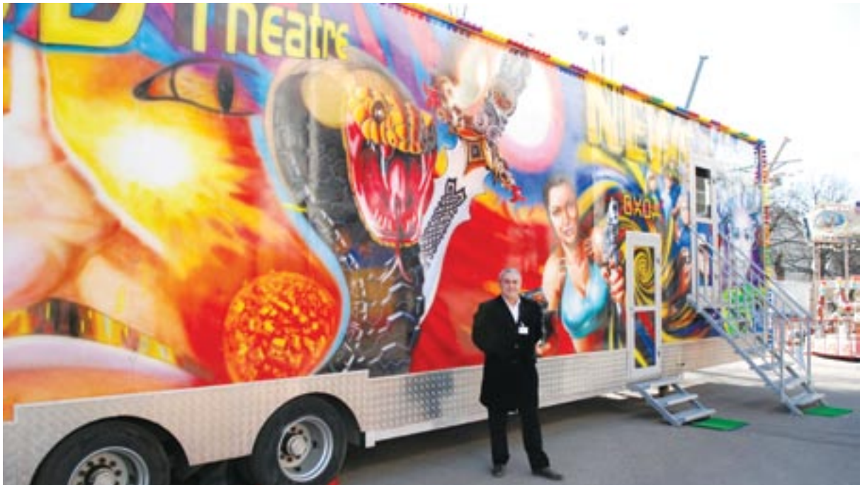
РАППА 2008. Хит сезона. 3D кинотеатр производства российской компании ПО «Грос», г. Красноярск

хозяйства в Стерлитамаке. Он остановился на организации работы парка зимой, отдельно затронул проблемы финансирования парков и законодательной базы.