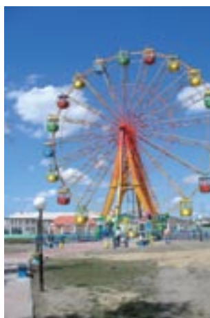
Аттракцион «Колесо обозрения» в пгт. Агинское, Забайкальский край