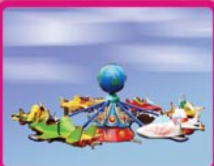
Аттракцион «ПОЛЕТ» Аттракцион для детей весом до 50 кг Кол-во посадочных мест – 8 Диаметр – 8 м Пропускная способность – 180 чел/час