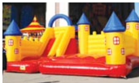
На выставке были широко представлены пневмоаттракционы различных российских компаний