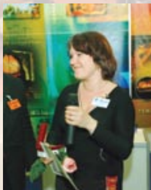
ООО «СБЛ-Тюмень», г. Тюмень