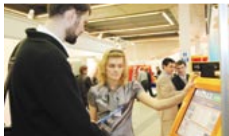
Посетители выставки проявляли повышенный интерес к вендинговому оборудованию