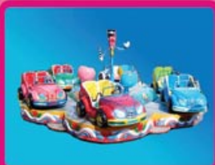
Аттракцион «Ралли» Кол-во посадочных мест – 15 Диаметр платформы – 6,5 м Пропускная способность – 450 чел/час Потребляемая мощность – 2,2 кВт