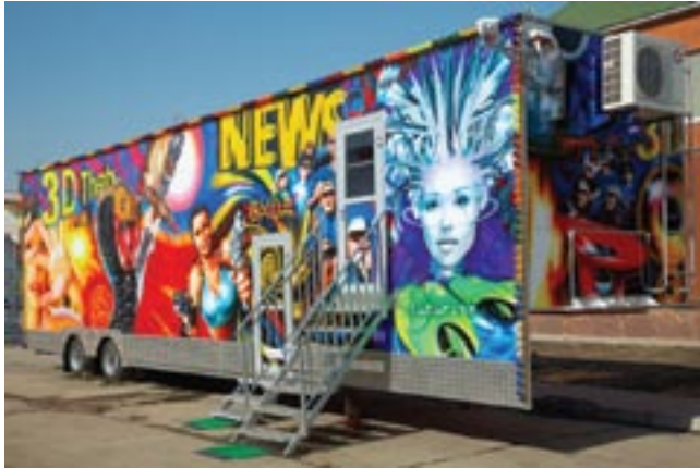
Аттракцион «3D Кинотеатр»