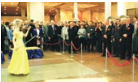
Торжественная церемония открытия выставки РАППА-2008

компания «МИР»(Россия), Гейм Трэйд (Россия), Fabbri Group (Италия), Moser Rides Srl (Италия), Heimo Animated Attractions (Германия), Mack Rides GmbH & Co. (Германия), KCC Entertainment Design (Бельгия), Inflatable Depot (Испания), ОДА (Россия), Аттракцион (Россия), Brunswick Bowling & Billiards Corp (США), Сармат (Украина) и многие другие.