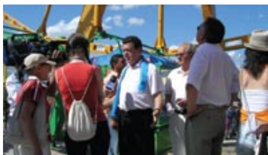
Иосиф Кобзон на открытии «Колеса обозрения» в пгт. Агинское, Забайкальский край