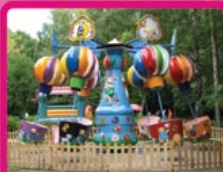
Аттракцион «ВОЗДУШНЫЕ ЦАРЬ» Высота – 5 м Диаметр по оси – 5 м Диаметр в разлете – 9 м Количество образов – 6 Кол-во посадочных мест – 18 Потребляемая мощность – 2 кВт Пропускная способность – 360-540 чел/час

391720, Россия, Рязанская область, Михайловский р-н., п. Октябрьский, ул. Почтовая, д. 4 Тел./Факс: +7 (491)302-10-97 моб.: 8 903 834-23-85. E-mail: faba81@mail.ru www.faba.ru