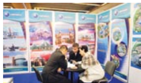
Компания «HYTECHNOLOGY» (Китай) плодотворно работала на своём стенде