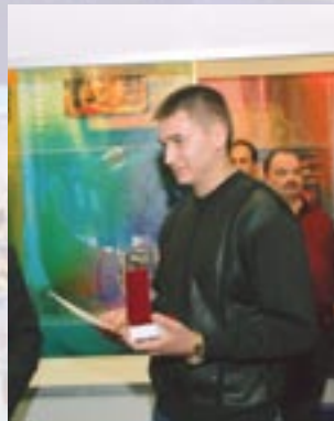
ОАО «Аттракцион», г. Ейск;