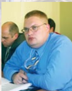
Компания «Brunswick Bowling & Billiards Corp», г. Москва