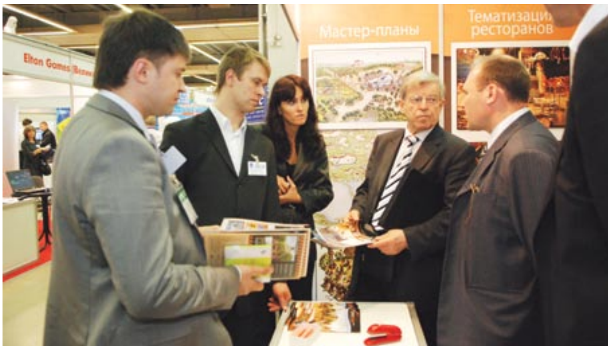
РАППА-2008. Успешно прошли переговоры на стенде компании «Jora Vision»

В работе секции №1 приняли участие директора муниципальных и частных парков аттракционов, производители развлекательного оборудования, представители органов государственной власти и контролирующих организаций, сотрудники сертификационных центров и испытательных лабораторий, другие заинтересованные лица.