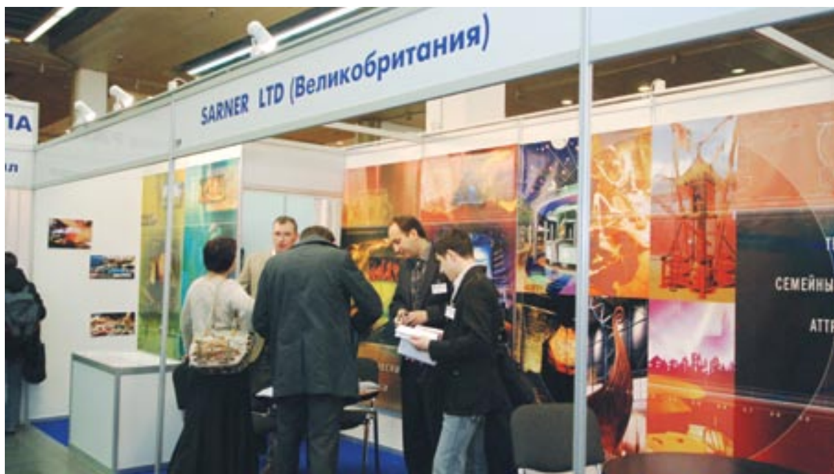
РАППА 2008. Работа на стенде компании «SARNER LTD» (Великобритания) была результативной

о комплексах виртуальной реальности, симуляторах, 4D кинотеатрах и о сотрудничестве с группой компаний «Транзас». Он отметил удобство и выгодность комплекса «Транс-Форс».