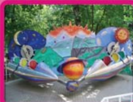
Аттракцион «Ракета» Кол-во посадочных мест – 6 Длина – 6 м, ширина – 4 м Подъем – 2,5 м Потребляемая мощность – 4,5 кВт