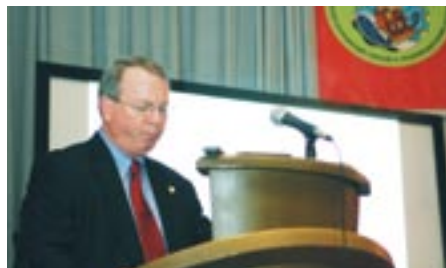
Чарли Брей – Президент IAAPA (США)