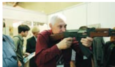
Каждый посетитель мог опробовать представленное на выставке оборудование