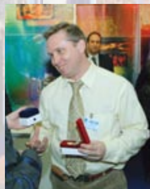
Компания «STUDIO FOURUS», г. Санкт-Петербург