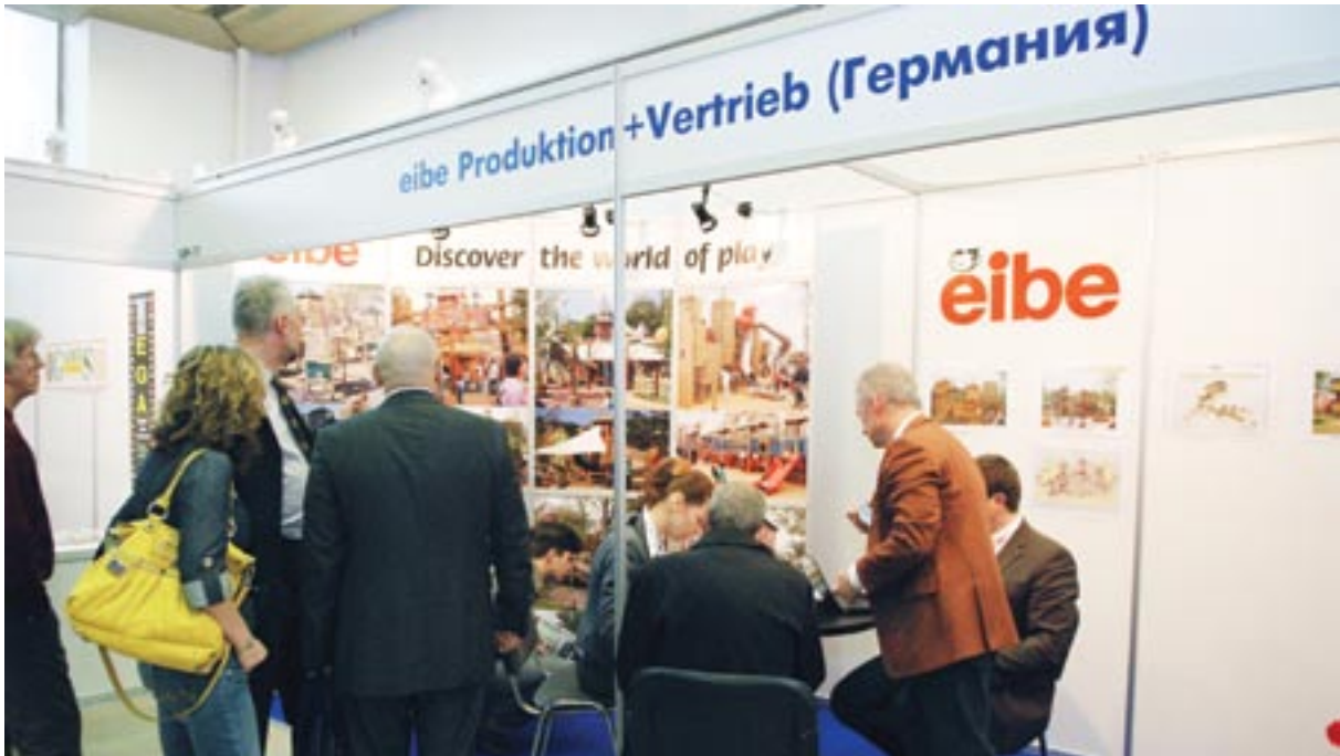
РАГПА 2008. Живой интерес посетителей вызвал стенд компании «eibe Produktion + Vertrieb» (Германия)