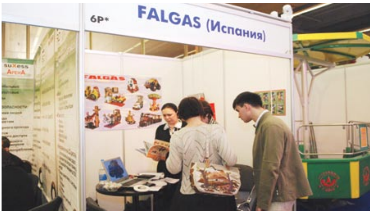
РАППА 2008. Детское развлекательное оборудование испанской компании «Falgas» нашло своего покупателя

и паркового бизнеса в России, ознакомила участников конференции с новостями в законодательстве РФ, относящимися к индустрии развлечений.