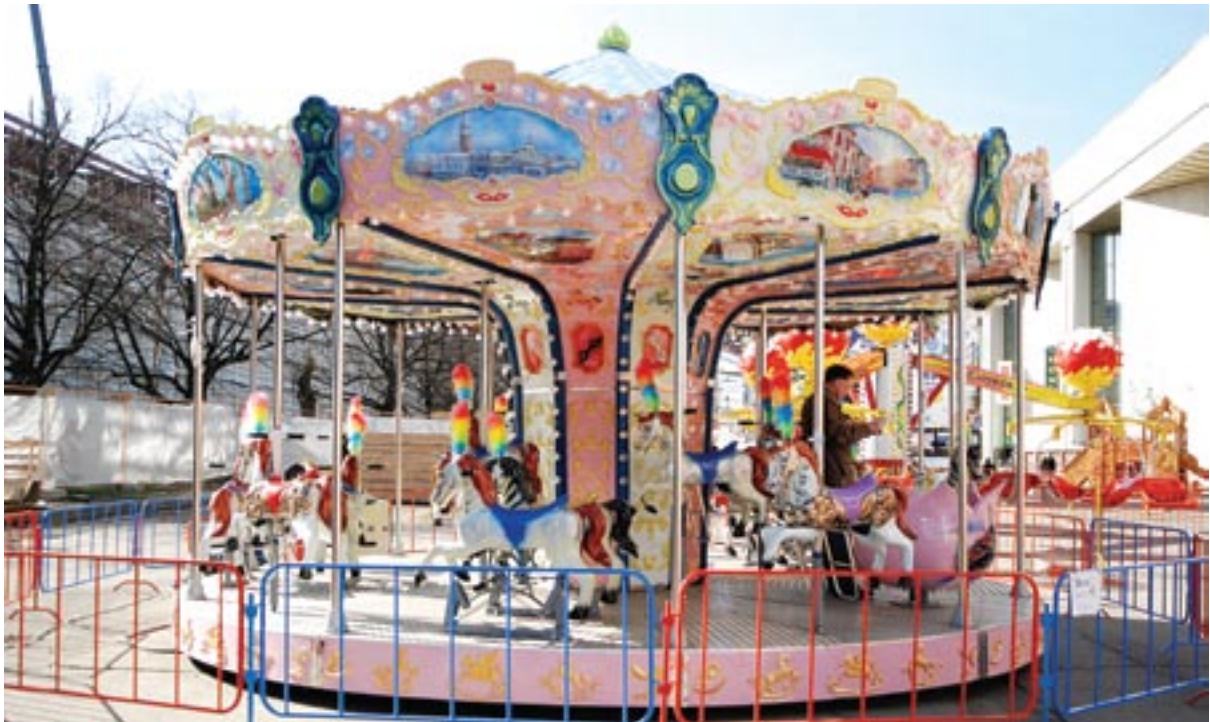
РАППА 2008. Отечественные аттракционы мирового уровня были широко представлены на выставке. Аттракцион «Лошадки» производства компании «Восток» (Россия, Санкт-Петербург)

компания «МИР»(Россия), Гейм Трэйд (Россия), Fabbri Group (Италия), Moser Rides Srl (Италия), Heimo Animated Attractions (Германия), Mack Rides GmbH & Co. (Германия), KCC Entertainment Design (Бельгия), Inflatable Depot (Испания), ОДА (Россия), Аттракцион (Россия), Brunswick Bowling & Billiards Corp (США), Сармат (Украина) и многие другие.