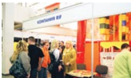
Успешно работала на выставке компания «RIF»

В заседании секции №3 приняли участие директора зарубежных и отечественных аквапарков. На заседании выступили: