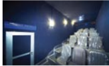
Аттракцион «3D Кинотеатр». Киностереозал