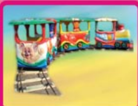
Паровоз «ВЕСЕЛЫЙ ПОЕЗД» Габариты пути – 18 x 6 м Длина – 50 м Количество кабин – 3 Количество посадочных мест – 10 Пропускная способность – 360 чел/час