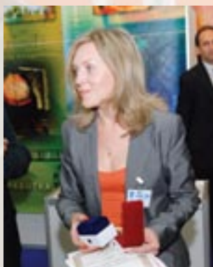
ООО «Дэником», г. Новосибирск