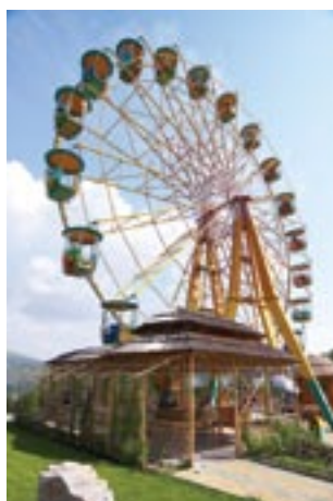
Аттракцион «Колесо обозрения» в г. Красноярск