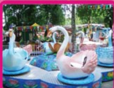
Аттракцион «Лебеди» Диаметр – 8 м Кол-во посадочных мест – 12 Пропускная способность – 360 чел/час