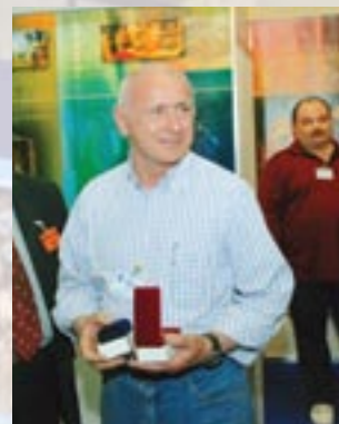
Компания «Antonio Zamperla S.P.A», Италия;