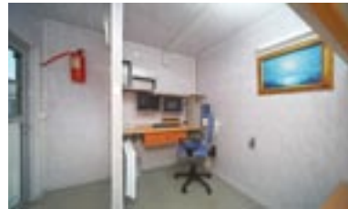
Аттракцион «3D Кинотеатр» Кабина управления