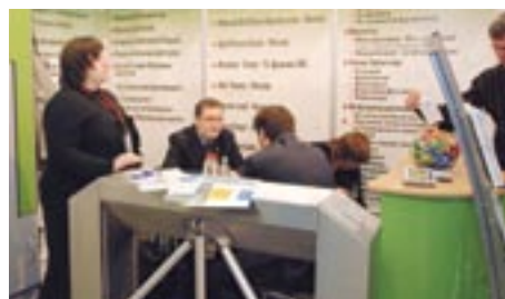
Компания «ISD» успешно представила оборудование по контролю и контролю доступа