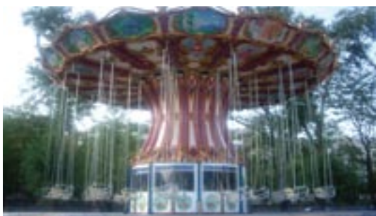
Аттракцион «Цепочная карусель»