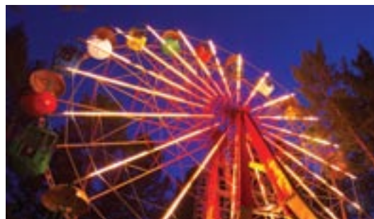
Аттракцион «Колесо обозрения» в г. Железногорск, Красноярский край