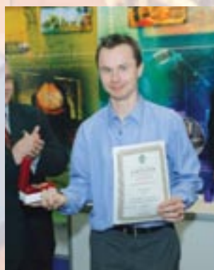
Компания «ОДА», г. Москва