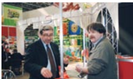
Живой интерес посетителей вызвал стенд компании «Antonio Zamperla S.P.A» (Италия)

Конечно, зимой происходит большой износ аттракционов, но если техническая служба работает хорошо, и своевременно осуществляется подготовка к зимнему периоду, то зимой работать можно и нужно».