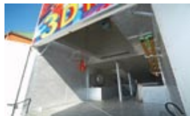
Аттракцион «3D Кинотеатр» Багажный отсек