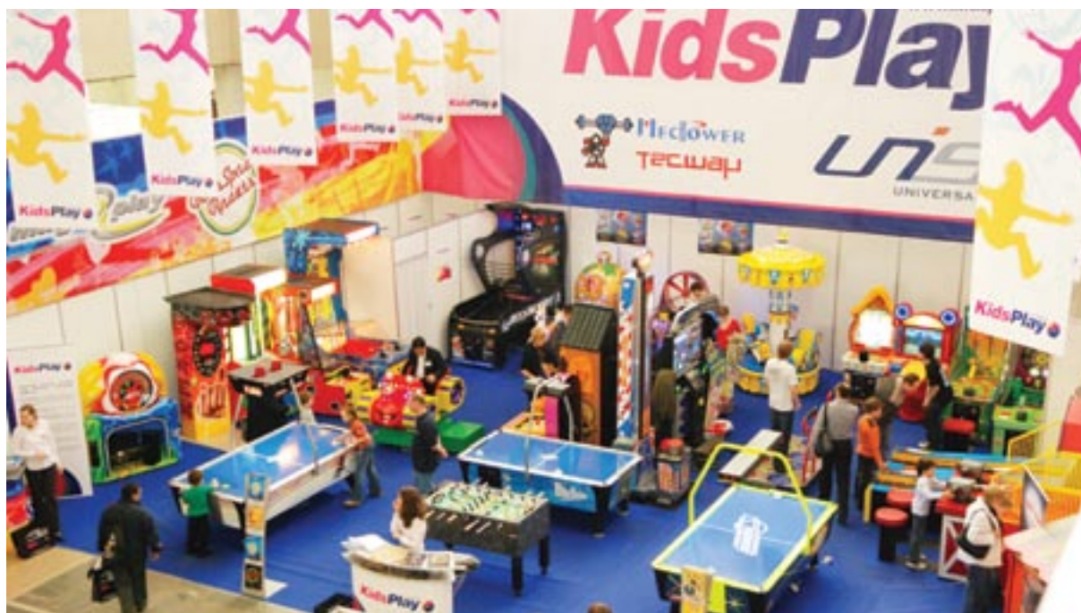
РАПГА 2008. В выставке приняли участие мировые производители развлекательного оборудования, такие как «Kids Play»

посетителей». Так же он затронул вопрос выбора целевой аудитории, поделившись статистикой: «На сегодняшний день многие центры получают больше половины выручки от людей в возрасте 28-35 лет, и даже те центры, которые планировались как семейные или детские».