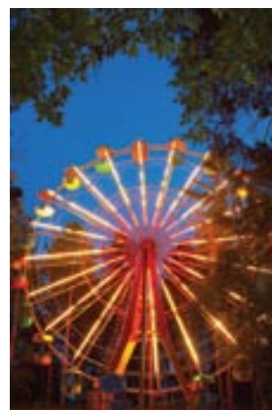
Аттракцион «Колесо обозрения» в г. Железногорск, Красноярский край