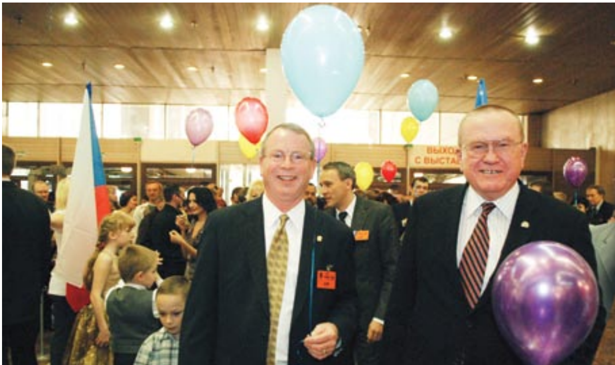
Почетные гости выставки РАППА-2008 Чарли Брей – Президент IAAPA и Роберт Мастерсон – Председатель Совета директоров IAAPA остались довольны выставкой