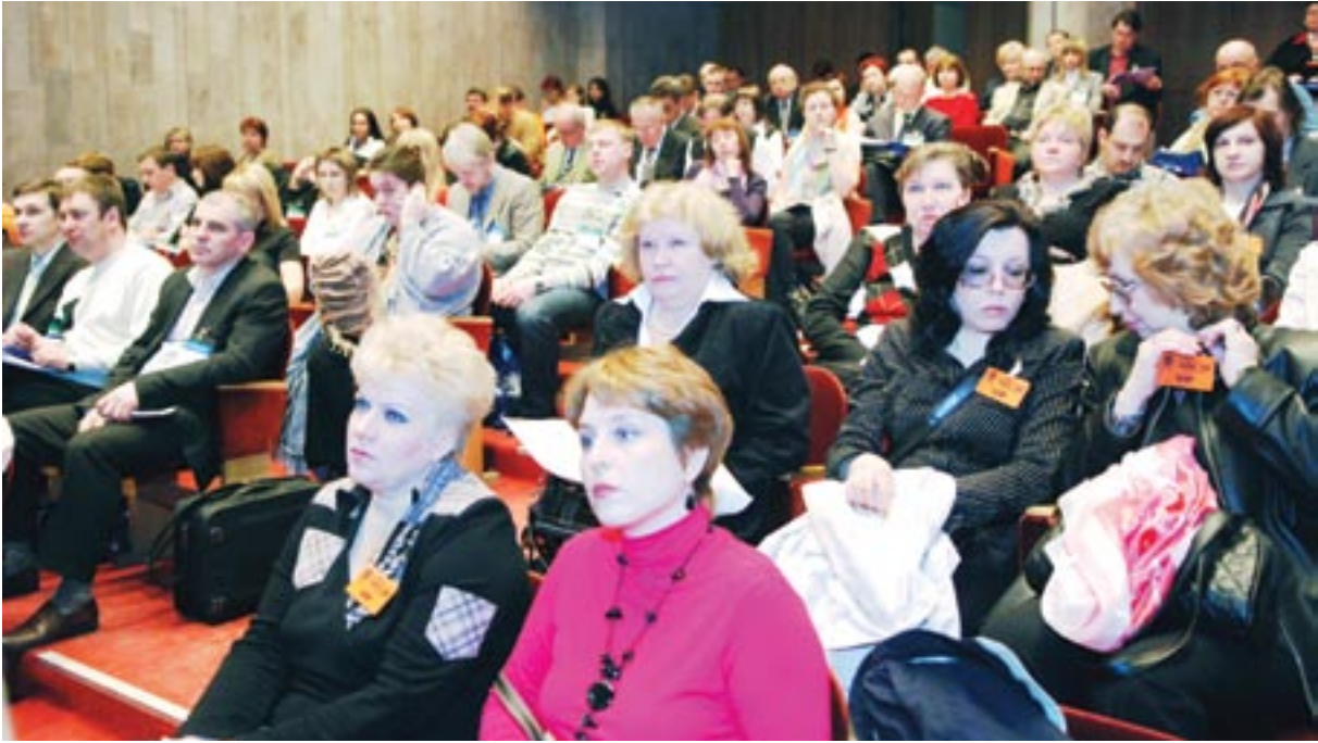
РАППА-2008. Участники конференции с интересом и вниманием слушали выступающих

сообществом инвалидов и государственными должностными лицами;