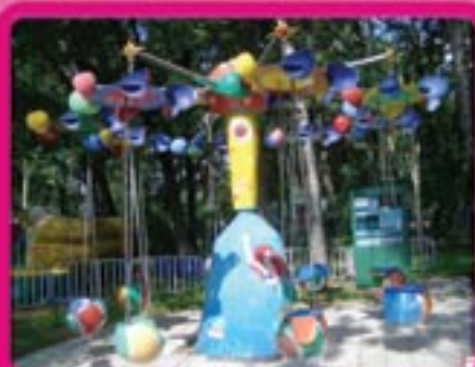
Целочная карусель «Космос» Для детей до 15 лет и весом не более 50кг Кол-во посадочных мест – 8 Размах во время движения – 9 м Высота – 4,5 м Потребляемая мощность – 1,5 кВт