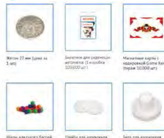
Жетон 27 мм (цена за 1 шт) Билетик для редемпшн автомата (1 коробка 100,000 шт) Магнитные карты с кодировкой Game Keeper (тираж 10,000 шт) Шары для сухого бассейна (набор 250 шт) Шайбы для аркадных (7см) Биты для аркадных