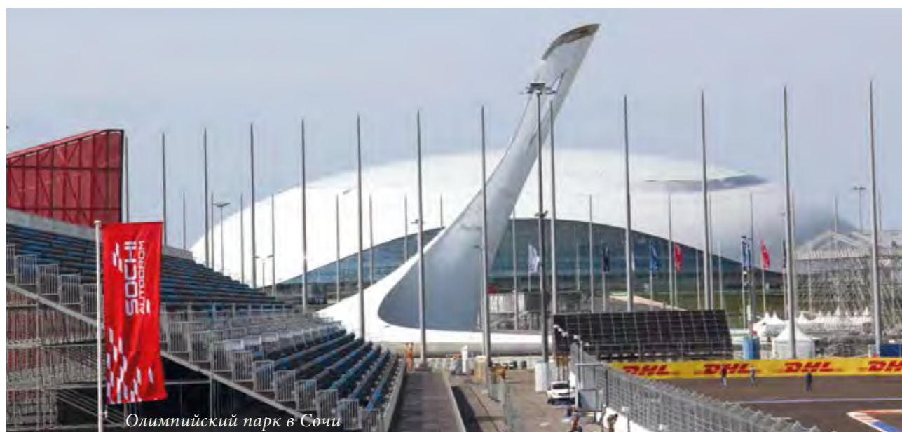
Олимпийский парк в Сочи

Одним из преимуществ расширения возможностей стадиона на основе целостного и комплексного подхода, является то, что его коммерческая деятельность может быть организована таким образом, что клубу не нужно нести основную финансовую нагрузку. Это достигается за счет оптимизации и нового структурирования проекта, усиления маркетинговой привлекательности стадиона, а также совершенствования управления, которое может быть передано третьим лицам (например, застройщикам или фондам). Работа с экспертами, которые могут определить потенциал объекта, разработать общую концепцию и дорожную карту, управлять финансированием и реализацией проекта, а также сформировать профессиональную команду, часто приводит к успеху и необходимым результатам.