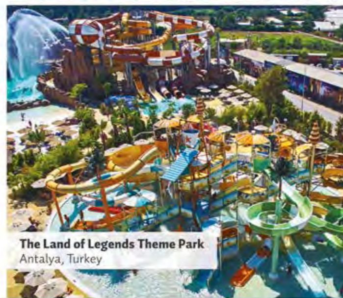
The Land of Legends Theme Park Antalya, Turkey