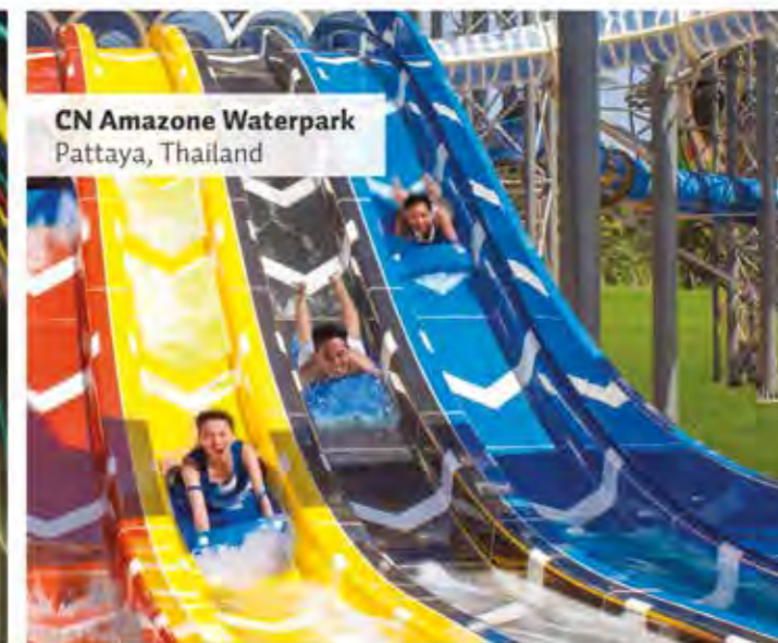
CN Amazone Waterpark Pattaya, Thailand