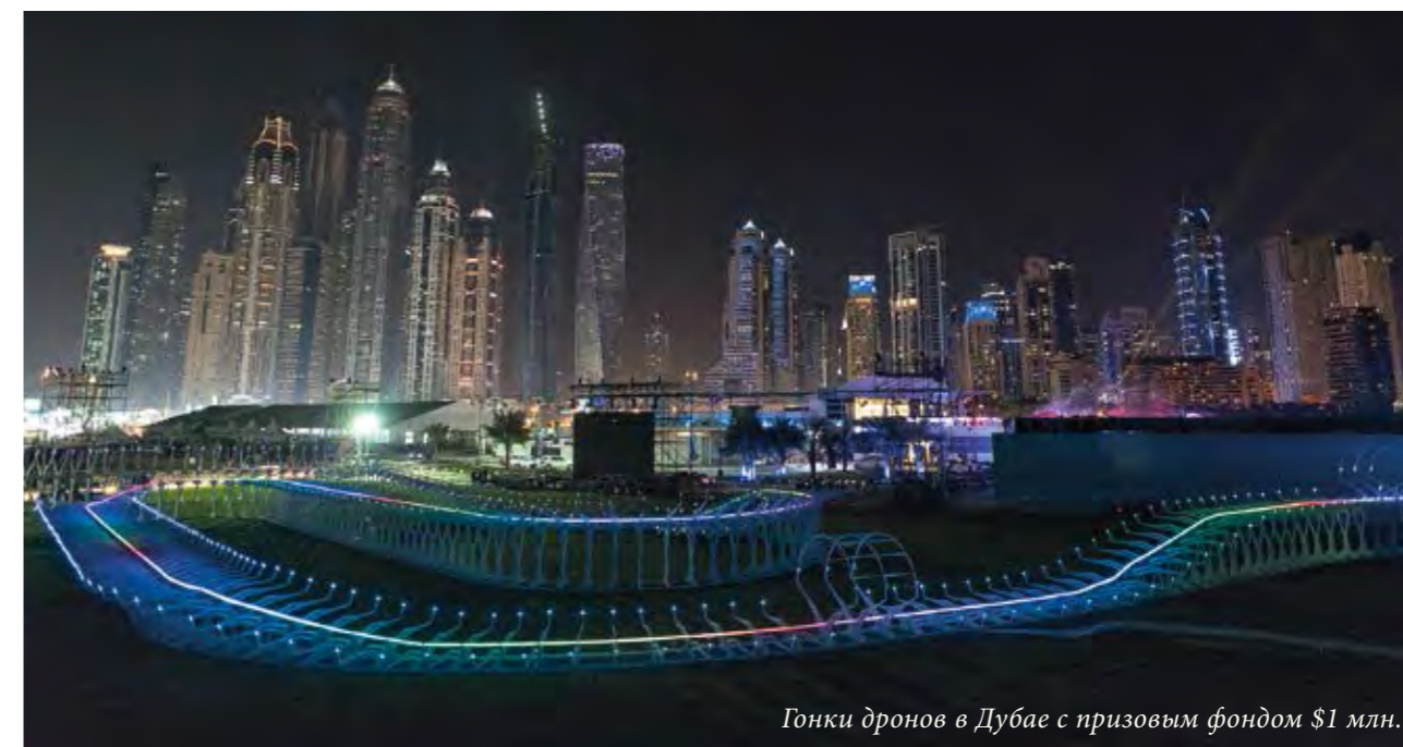
Гонки дронов в Дубае с призовым фондом $1 млн.

«Основополагающие принципы Disney – творческий подход и инновационные способы повествова-