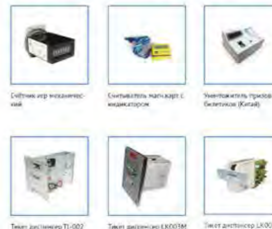
Счетчик игр механический Считыватель карт с индикатором Учетчик билетов (Китай) Тикет диспенсер TI-002 Тикет диспенсер LK003M Тикет диспенсер LK002A