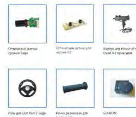
Оптический датчик оружия Sega Оптический датчик для игры N1 Корпус для House of the Dead 4 с прошивкой Руль для Out Run 2 Sega Ручка резановая для мотоцикла GD-ROM