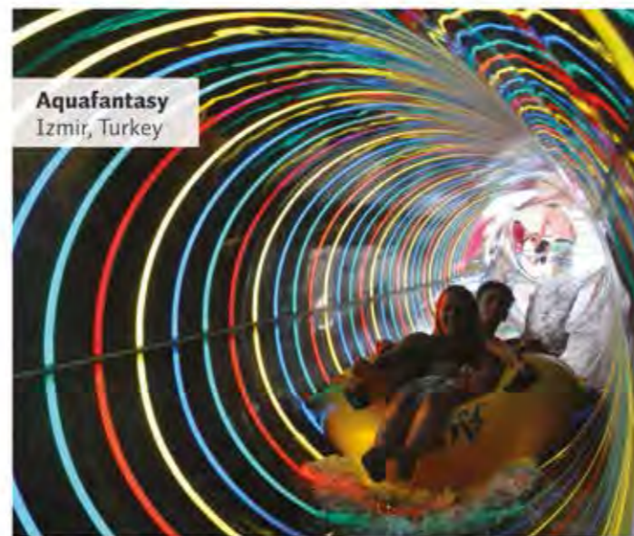
Aquafantasy Izmir, Turkey