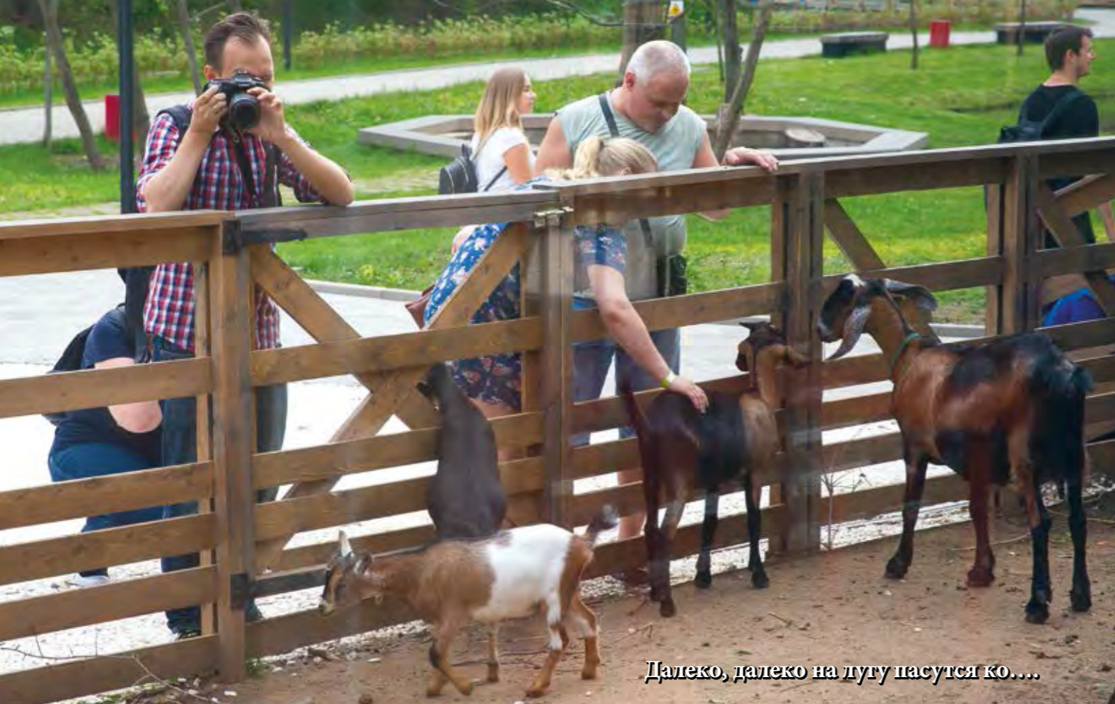
Далеко, далеко на дугу пасутся ко....