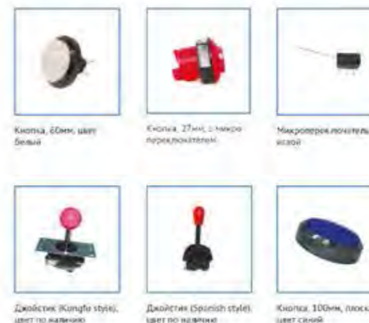
Кнопка, 60мм, цвет белый Кнопка, 27мм, с микропереключателем Микропереключатель с кнопкой Двойствия (Kunfu style), цвет по умолчанию Двойствия (Spanish style), цвет по умолчанию Кнопка, 100мм, плоская, цвет синий