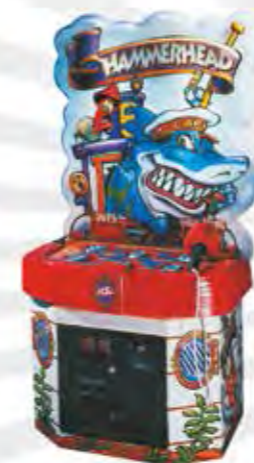
HAMMER HEAD (ICE)