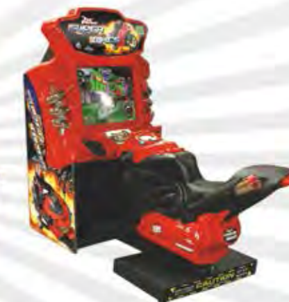
SUPER BIKES (Raw Thrills)