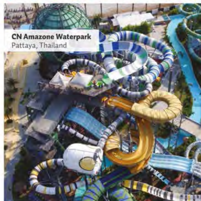
CN Amazone Waterpark Pattaya, Thailand