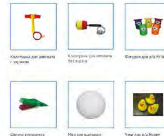
Колотушка для автомата с экраном Колотушка для автомата без экрана Фигурки для р/а Mr Wolf Фигуры крокодила (три части) Мяч для шариков Угол для р/а Happy Ducks