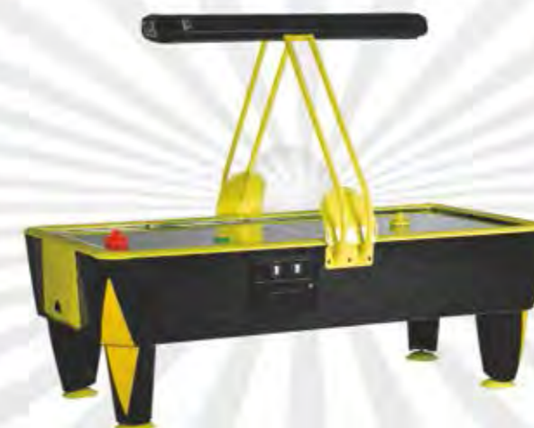
COSMIC (SAM Billiards)