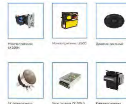
Материнские LK100M Материнские LK500 Дискеты оптические БК joystick Блок питания ZX 100-5 (5VSA 12VSA 24V2A) Контроллеры ИСТ L775