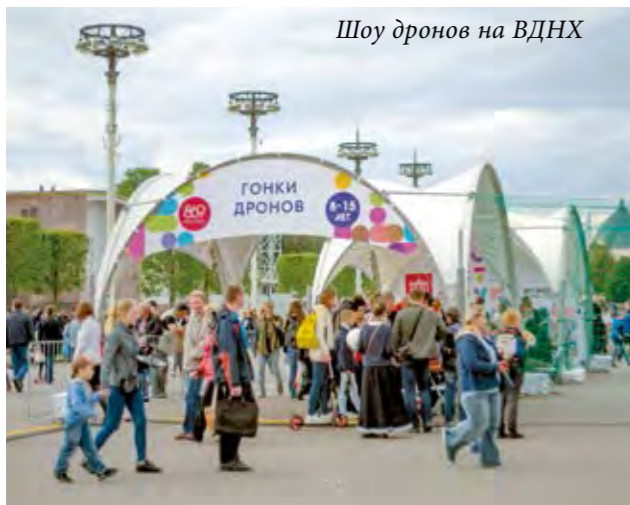
Шоу дронов на ВДНХ