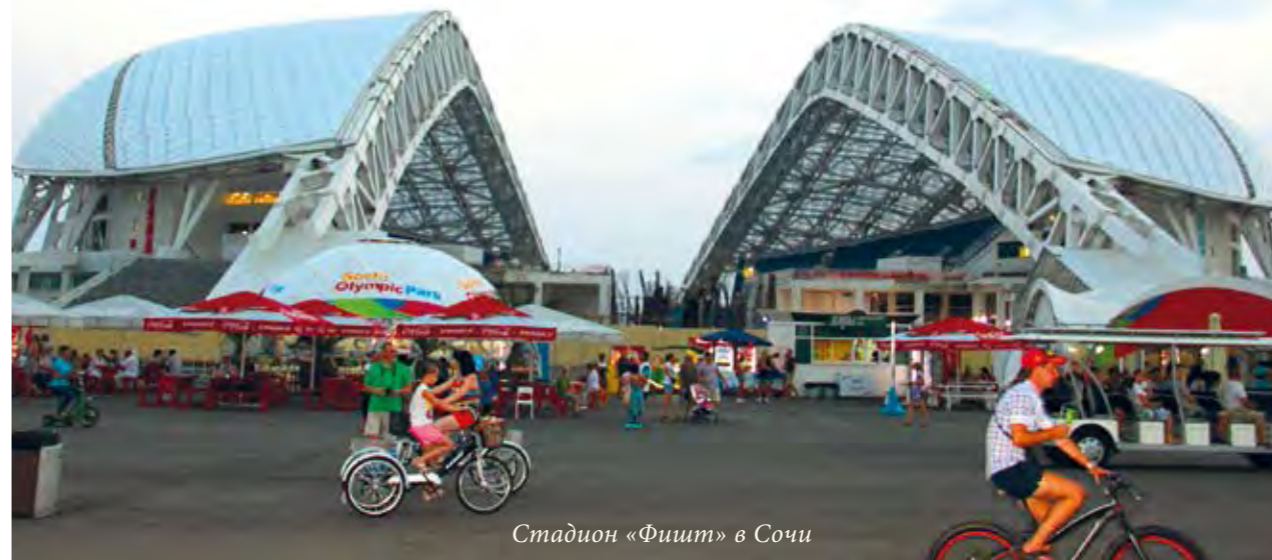
Стадион «Фишт» в Сочи